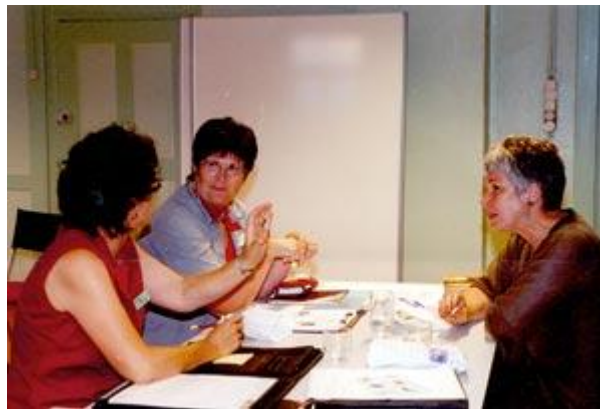
Im Schulmuseum Amriswil

Wir schliessen den Jahresbericht mit einem Ausschnitt aus dem Lied: Zwischen den Welten. (Zitat aus der Einladung für die Jahrestagung der Konferenz der Lehrkräfte Textilarbeit/ Werken 2002). Dieser Titel bildet auch das Thema für das nächste Impulsgruppenjahr.